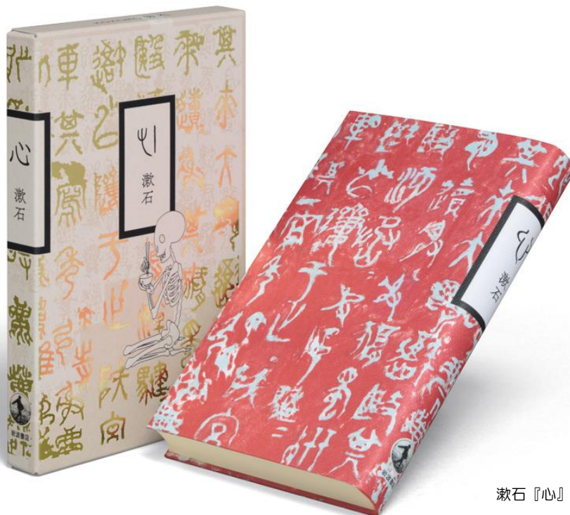
漱石『心』（岩波書店 2014 年）

「うまくいかない喜び」を軸に活動を展開するグラフィックデザイナー、祖父江慎（そぶえ しん）氏。その独特な感性と鍛え抜かれたデザイン力により常に私たちの意表を突く作品を世に送り出してきました。本の中身・内容をいかに伝え、読者に訴え得るかが装丁やブックデザインの基本ですが、優れたデザインはその本の世界をより魅力的に語ります。本展では祖父江氏と氏が主宰するコズフィッシュのブックデザインを通して、フィジカルな「本」の魅力を探ります。デジタルデバイスの登場によりすっかり様変わりした感のある私たちの読書環境。そんな中、本がどのように作られるのか、そのプロセスを追いながら、紙の本だからこそその表現を求めて 1 冊に込められる情熱に迫ります。*タイトルは「 ブックデザイン 」ではなく「 ブックデザイ 」です。