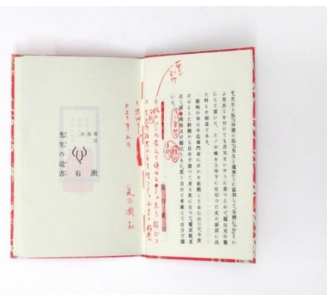
漱石『心』（岩波書店 2014年）

『心』『吾輩ハ猫デアル』新装版展示室。現在制作中の『吾輩ハ猫デアル』の完成形は後期展示でお目見え。