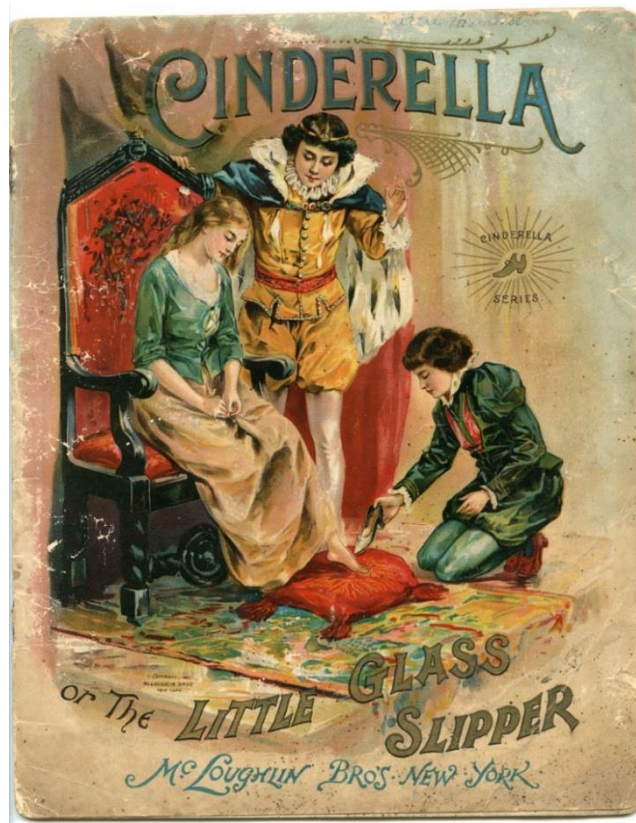
McLoughlin Bros. 社版『シンデレラ』 (1897年)

シンデレラの物語は世界各地に様々なバージョンがあり、その起源には諸説あります。17世紀フランスの作家シャルル・ペローや19世紀ドイツの民話研究家グリム兄弟のバージョンを介してヨーロッパ中に広まり、その後、アメリカに渡りました。シンデレラは、「夢に向かって着実に努力を続ければ、誰もが必ず成功できる」というアメリカン・ドリームを体現する物語として、アメリカで人気を博し、数多くの絵本が出版されました。現在では、ディズニーのシンデレラがよく知られていますが、歴史をさかのぼると、シンデレラにも、様々なストーリーがあることがわかります。