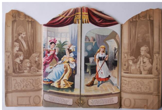
McLoughlin Bros. 社版『シンデレラ』(1891年)