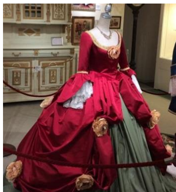
Brown, Taggard & Chase 社版『シンデレラ』 (1858年)の再現ドレス