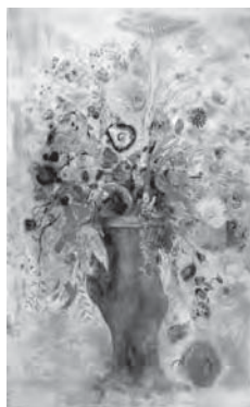
《グラン・ブーケ(大きな花束)》 1901年、248.3cm×162.9cm パステル/画布 三菱一号館美術館蔵

《グラン・ブーケ(大きな花束)》(三菱一号館美術館蔵)はフランスのブルゴーニュ地方ヴェズレー近郊のシャトーに秘蔵されていた、幻の大作でした。2011年にパリで初めて公開された時、現在オルセー美術館が所蔵する15点の装飾画とともに展示されると、大きな反響を巻き起こしました。三菱一号館美術館内に久しぶりに勢ぞろいする一連の装飾画は、ドムシー男爵が注文したのですが、男爵は謎が多く、肖像写真すらも見つかっていません。「ルドン - 秘密の花園」展出品作と描いた画家、そして注文主の謎に迫ります。