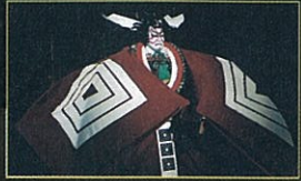
「舞」鎌倉権五郎景政 / 市川團十郎

江戸初期に初代團十郎が創始し二代目が完成させた「荒事」は、市川團十郎家のお家芸であり江戸歌舞伎を代表する演出となりました。人気演目「勸進帳」をはじめとする「歌舞伎十八番」の衣裳や小道具、役者絵などの資料を展示し、その魅力を紹介します。