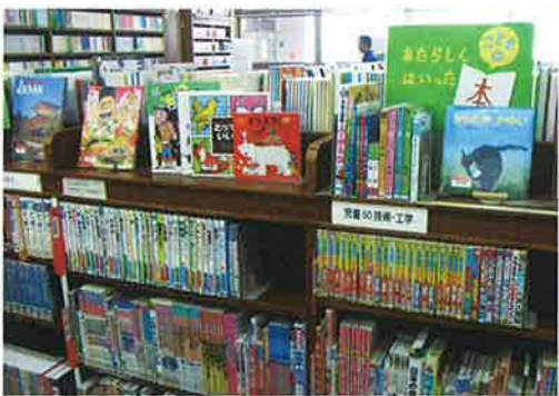
新しく入った本は見やすい高さに配架。

千代田区には区立図書館、大学図書館、専門図書館など、多種多様な図書館があります。前号では、区立図書館の中で千代田図書館に次いで2番目の歴史と規模を誇る「四番町図書館」を取り上げました。今号では「まちかど図書館」と呼んでいる2館をご紹介します。どこか温かい雰囲気は、まちなかにある小さな図書館ならではの。近隣にお住まいの方だけでなく、ビジネスパーソンが立ち寄りたりと、誰もが気軽に利用できる、貸出サービス中心の図書館です。