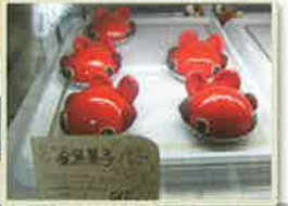
「金魚菓子」は見た目だけでなく、味も◎