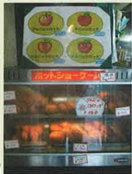
かわいいポスターが目印。

明治45年創業の老舗の肉屋で、現在は肉の卸と惣菜を販売しています。山形出身の女将さんが発案した看板商品「りんごコロック」の中には、ホクホクのじゃが芋とシロップ漬けのりんご、挽肉、玉ねぎが入っています。挽肉のジューシーさと、真ん中にコロコンと入っている甘いりんごの組み合わせは、一度口にするとなぜか忘れられない味わいです。神田に嫁いであらうとこの街を見てきた女将さんの話はとても興味深く、人柄の良さや笑顔が印象的です。