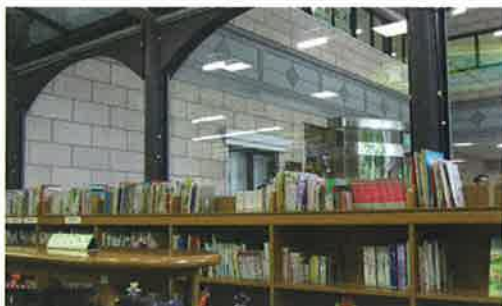
児童書コーナーは天井までガラス張りの、明るい空間にあります。最下部にスタッフが色紙でつくった作品を飾り、楽しいコーナーになっています。