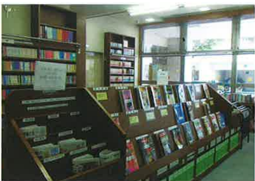
新聞・雑誌、文庫本は光がさしこむ明るい空間にあります。