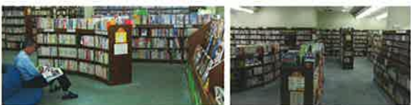
新聞・雑誌コーナーには、大きな柱をぐるりと囲むソファ席があり、ちょっと新聞をチェックしたり雑誌をみるのにぴったり。(左) メインカウンターから見た、館内のようすです。(右)