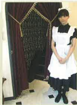
ここから、別世界へ… (メイド喫茶ではありません)

「秋葉原に女性が1人でもくつろげる場所を」と昨年12月にオープン。正統派の仏蘭西菓子と珈琲・紅茶、さらに、厳選素材を使用した洋食も楽しめます。グラスなどの小物類やトイレの内装に至るまで上質感たっぷり。常連さんだけが案内してもらえると、という3階の会員制サロンは、さらにゴージャスな空間で優雅なひとときが過ごせます。