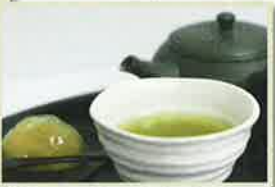
厳選煎茶(お菓子付き) 茶・水・茶器・技すべてにこだわった一級煎茶

今年9月にリニューアル。日本茶を中心に、オリジナルスイーツやドリンクが楽しめるカフェです。水にもこだわり、天城山系の天然水を毎日運んでいるそうです。夜も気軽に立ち寄れるよう、生ビールや軽食の価格を350円に設定。店内は完全分煙で、無線LANも使用でき、打ち合わせやPC作業に利用する姿も見られます。スタッフには日本茶インストラクター資格所有者もいるので、おすすめを聞いてみてはいかがでしょうか。