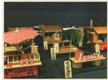
ちよん子のミニチュア縁日