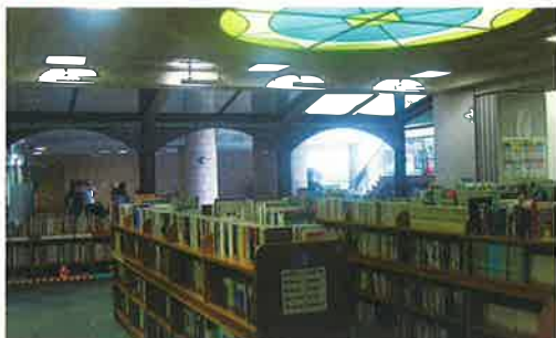
スタンドグラス風の天井が、館内の雰囲気明るくしています。この天井の下辺りは書架が低く、館内奥の方では、背の高い書架にずらりと本が並んでいます。

入口左には、手作りの色紙オーナメントを飾っています。季節ごとに内容が変わるので、この情報誌が出る頃には秋仕様になっているはず。(左) 「外神田偉人シリーズ」と題して、昌平小学校の先生が作っているミニ銅像です。その人物にまつわる歴史などについても掲示があり、勉強になります。写真(8月撮影)は「木下順庵(江戸時代前期哲学者)」です。(右)