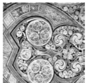
ケルト渦巻文様 『ケルズの書』より(部分) ダブリン大学

ケルトの人々の豊かな自然観・生命観は、『ケルズの書』に見られる渦巻、動物、結び目、組紐などの神秘的な文様・デザインに反映され、アール・ヌーヴォーにも影響を与えました。ケルト系の人々によって伝えられてきた芸術文化を通して、日本人の心と響き合う特色に迫ります。