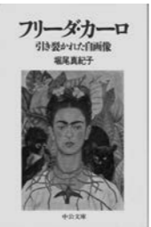
『フリーダ・カーロ 引き裂かれた自画像』堀尾眞紀子 中文文庫(1999)

20世紀前半に自画像を描いた女性画家たち、三岸節子、レメディオス・ヴァロ、フリーダ・カーロらは描く・描かれる構図を見事に覆し、自分とは、社会とは、今を生きるとは…様々な問いを観る者に投げかけます。彼女たちの自画像から、2度の大戦を経た時代背景、その中で作品を紡ぎ出す原動力は何かを探ります。