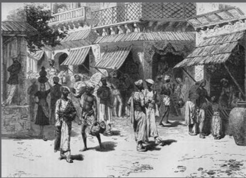
インド デリー市内 チャンドニー・チョーク市場 (Louis Rousselet著/ 『L'Inde des Rajahs』/1877年)

内田嘉吉文庫で所蔵している地理書、航海記・探検記、写真集からはその当時の街の様子がよくわかります。今回の企画展示では18～19世紀に発行された資料を中心に、所収の図版から、貿易や商業で栄えた街、政治の中心、文化都市など街の興隆の様子をパネルで紹介いたします。繁栄する街の時代による変遷についてもご覧ください。