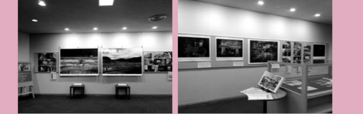
↑迫力のある大型写真が目を引きまます。 ↑今は更地になっている町並みが写真の中には残っています。