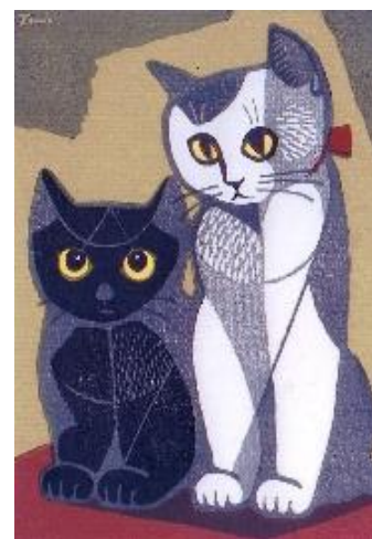
稲垣雄雄 子猫 昭和

参加費：1,000円（材料費込み）※ 参加に際しては、必要な方は拡大鏡等をお持ちください。