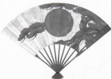
真田軍扇(原本:松江市指定文化財、松江神社蔵)