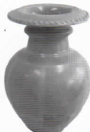
江戸城汐見多間櫓台石垣出土花瓶