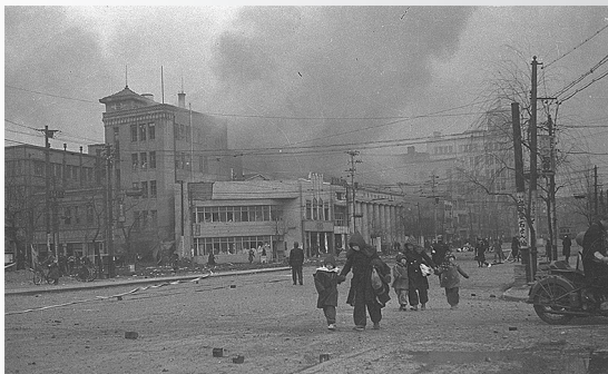
数寄屋橋付近の通りを逃げ惑う親子 1945年1月27日午後3時