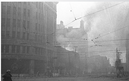
炎上している銀座4丁目西側の教文館 1945年1月27日