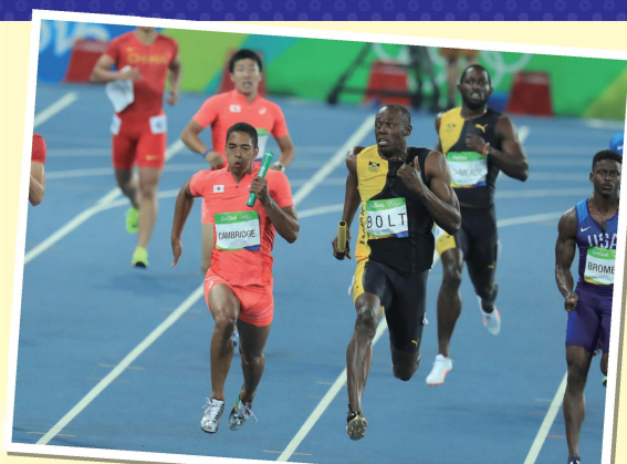
【リオオリンピック陸上】400メートルハルレー決勝、ジャマイカのウサイン・ボルト(右)と競り合う日本のアンカー、ケンブリッジ飛鳥選手

あわせて、オリンピック・パラリンピックに関連する本約200冊や毎日新聞の記事、1964年の東京オリンピック・パラリンピックの記録写真(毎日新聞社所蔵)なども展示します。