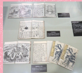
日比谷図書文化館展示室